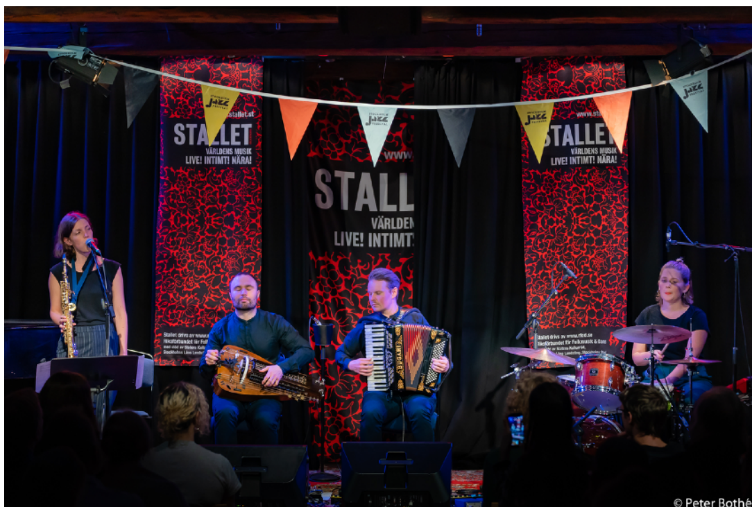
Konserten med Symbio och Sisters of Invention i sam med jazzfestivalen

Fasching, Kungliga Musikhögskolan, Kulturens, NBV (nykterhetsrörelsens bildningsförbund), är bara några av alla organisationer och föreningar som Stallet fortsätter att samarbeta med både när det gäller konsertverksamhet men också genom erfarenhetsutbyte och samarbete när det gäller publikutveckling, konstnärlig kvalitet och andra gemensamma frågor. Vi ökar samarbeten med arrangörer/aktörer ute i landet genom nya nätverk och kontakter med folk- världsmusikscener i Sverige.