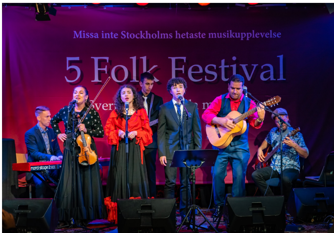
5 Folk Festival på Stallet Världens Musik

Stallet har idag som enda scen i Stockholms län med en tydlig profil på folk- och världsmusik en unik position. Stallet fungerar som ett viktigt nav i Stockholms folk- och världsmusikscen och flera organisationer som till exempel Farhang, E Romani Glinda, NBV, KMH m.fl samarbetar och använder Stallet som scen för sina evenemang. Som nationellt viktig arrangör och producent är Stallet även folk och världsmusikbranschens ansikte mot världen och spelar en viktig roll i exporten av svensk folk- och världsmusik.