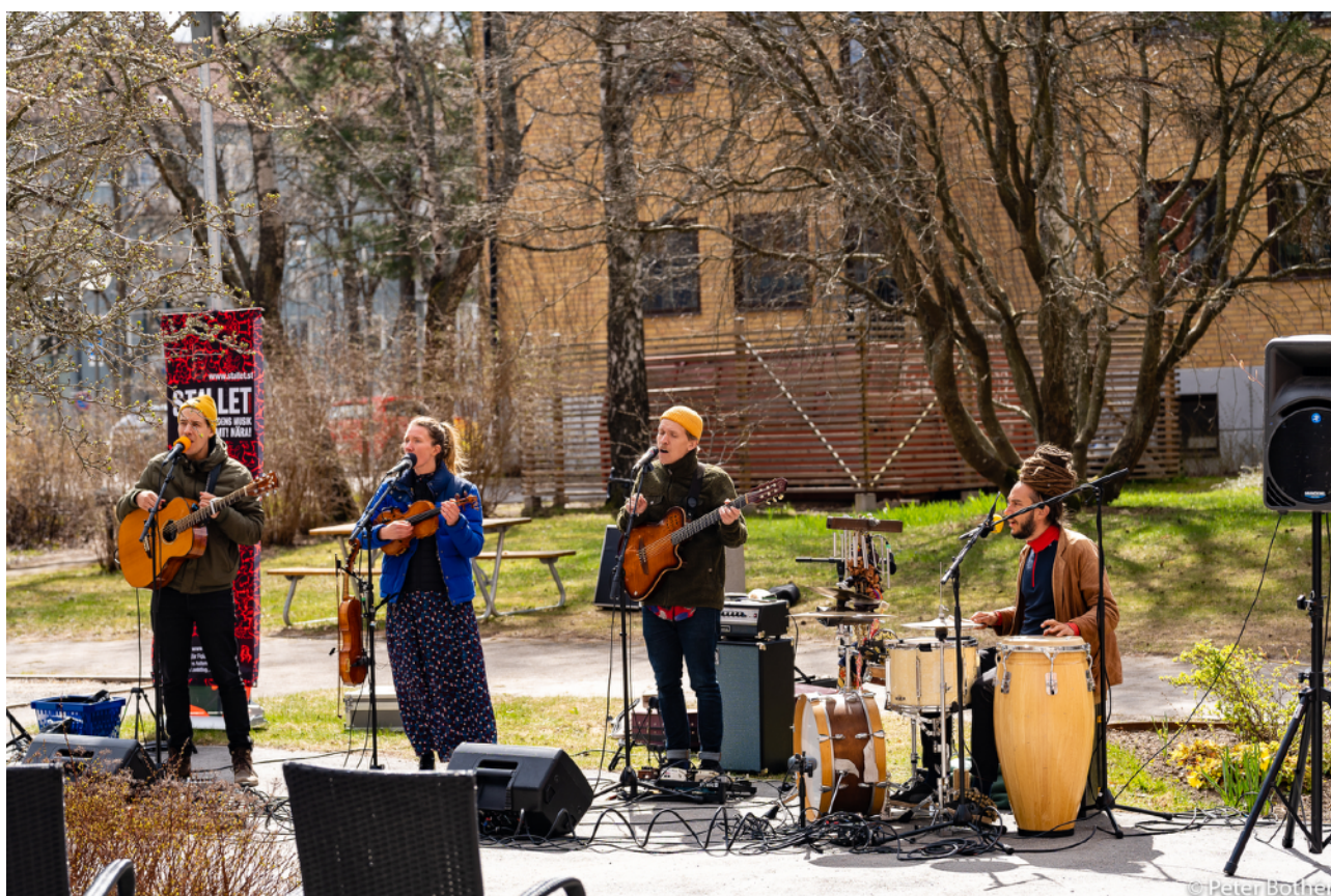
Koloniens konsert utanför Tallhöjdens Servicehus i Haninge

Genom underlabeln Stallet@ arrangerar vi evenemang utanför stallets ordinarie lokaler på Stallgatan 7. Efterfrågan på Stallets kompetens ökar och Stallet arrangerar konserter i Kungsträdgården, på Stockholms kulturfestival och i samarbete med Parkteatern runt om i staden. Vi samarbetar intimt med Haninge kommun med konsertverksamhet i Haninge, Jordbro och Brandbergen.