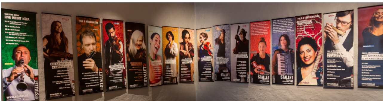
Affischutställning på Stallet "folk/världsmusikens Hall of Fame"

Stallet har utvecklat sin kompetens vad gäller streaming där erfarenheter från tidigare video och fotodokumentation varit värdefullt. Viktigt har varit att publiken ska få en "LIVE INTIMT NÄRA! -upplevelse även hemma i soffan. Streaming kommer att fortsätta att vara ett sätt att ta del av kulturupplevelser även efter coronapandemin och det är viktigt att kvalitén på utsändningarna gör artisterna rättvisa så det inte motverkar lusten att gå på konsert live. Därför vässar vi kompetensen genom utbildning, nya verktyg och extern kompetens. Fler aktörer kommer till Stallet för att ta del av Stallets know-how inom streaming och sänder konserter och workshops från Stallet.