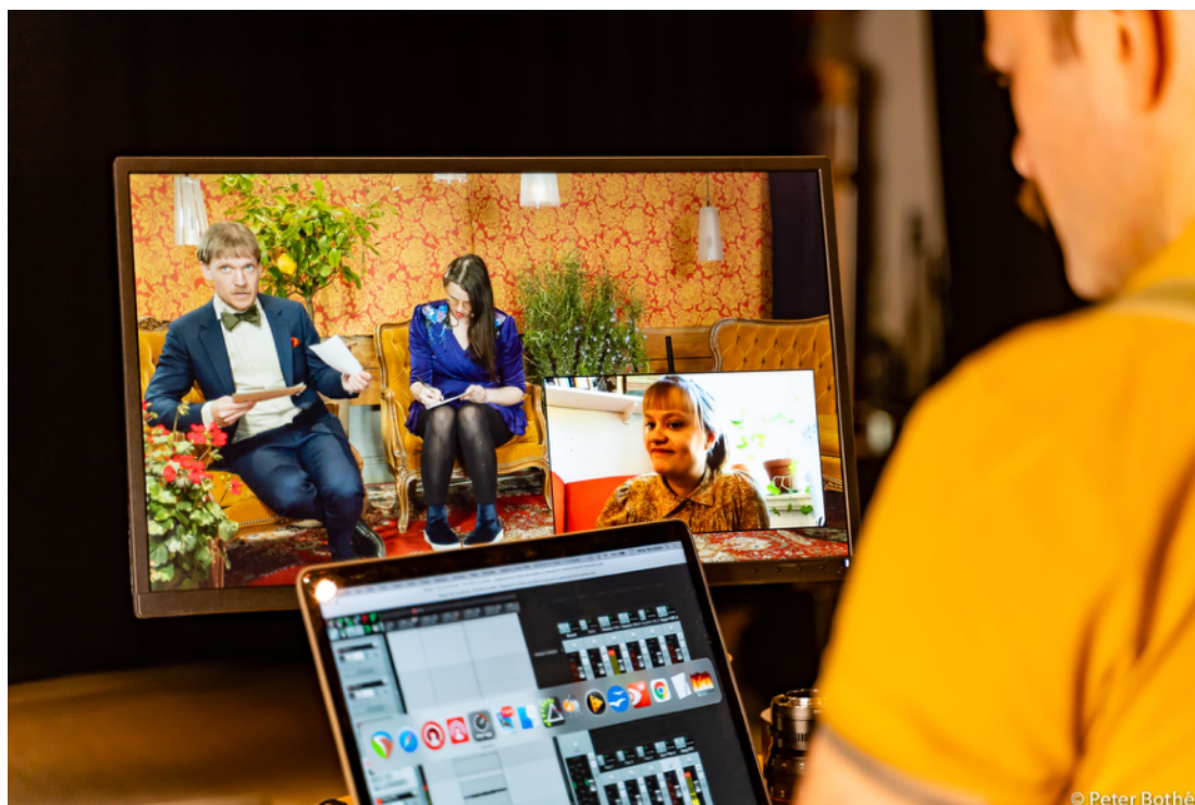
Streaming från Stallet Världens Musik

Stallet har utvecklat sin kompetens vad gäller streaming där erfarenheter från tidigare video och fotodokumentation varit värdefullt. Viktigt har varit att publiken ska få en "LIVE INTIMT NÄRA! -upplevelse även hemma i soffan. Streaming kommer att fortsätta att vara ett sätt att ta del av kulturupplevelser även efter coronapandemin och det är viktigt att kvalitén på utsändningarna gör artisterna rättvisa så det inte motverkar lusten att gå på konsert live. Därför vässar vi kompetensen genom utbildning, nya verktyg och extern kompetens. Fler aktörer kommer till Stallet för att ta del av Stallets know-how inom streaming och sänder konserter och workshops från Stallet.