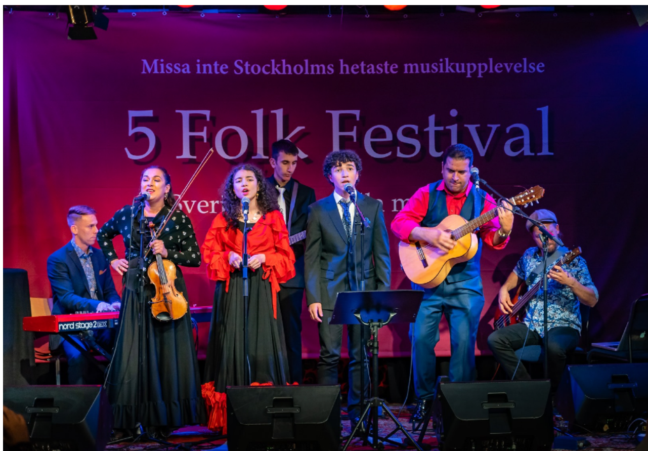
5 Folk Festival på Stallet Världens Musik

Stallet arrangerade 66 evenemang med över 7000 fysiska besökare, 117 000 tog del av Stallets streamade konserter. Vid 43 av evenemangen samarbetade vi med andra aktörer och på scenerna tog 43% kvinnliga kulturarbetare och 57% män plats. De fem nationella minoriteterna tog plats på Stallet via samarbetet med E Romani Glinda och 5 Folk Festival.