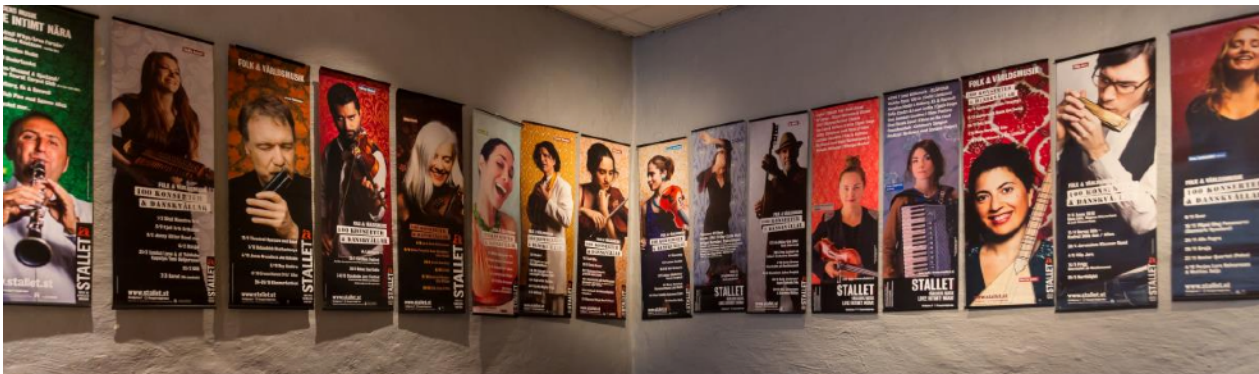
Stallets egenproducerade affischer

Stallets hemsida är ett offentligt arkiv för alla evenemang som ägt rum på Stallet sedan starten 2000. Med information om konserter, dansevenemang, seminarier och mycket annat. Uppgifter om band, enskilda artister, m.m.