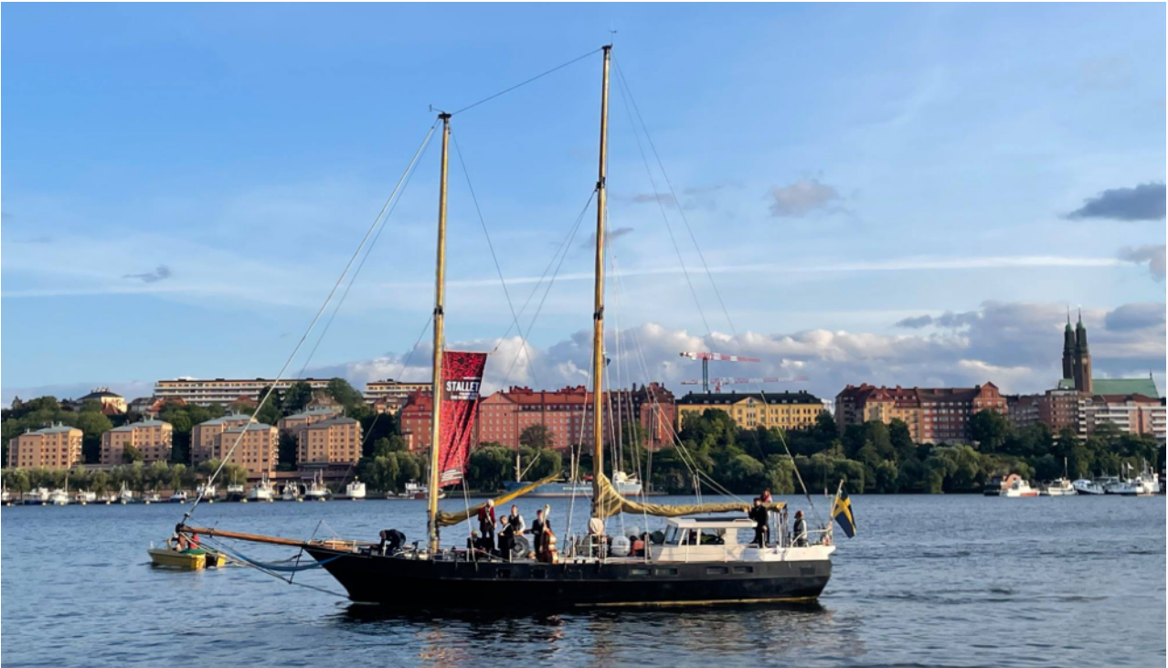
Stallet - Världens Musik till sjöss

Programläggningen görs utifrån RFoD:s visioner om mångfald i musiklivet som handlar om att synliggöra folk och världsmusikens alla delar och uttryck kvinnliga utövare, invandrade artister äldre traditionsbärare och nya utövare. Stallet har också en ambition att ge plats åt och släppa fram nya initiativ inom genren.