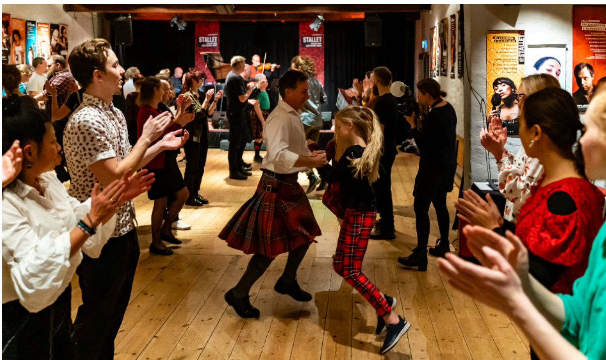
Skotsk konsert- och danskväll i samarbete med Ceilidh Stockholm

Stallet Friends är Stallets gästscen för externa arrangörer/producenter/fria grupper som erbjuds möjlighet använda Stallet till självkostnadspris. 2021 ägde 19 (22) Stallet Friends-arrangemang rum. Självkostnaden innehåller direkta personalkostnader för eventet (entrévärd, scenvärd, ljudtekniker och stimavgift) som för 2021 budgeterades till 8.000 kr. Grundtanken med Stallet Friends är att hålla bokningsprocessen öppen och demokratisk genom att välkomna initiativ utifrån! Stallet bidrar med scen och arrangörskompetens, marknadsföring och teknik.