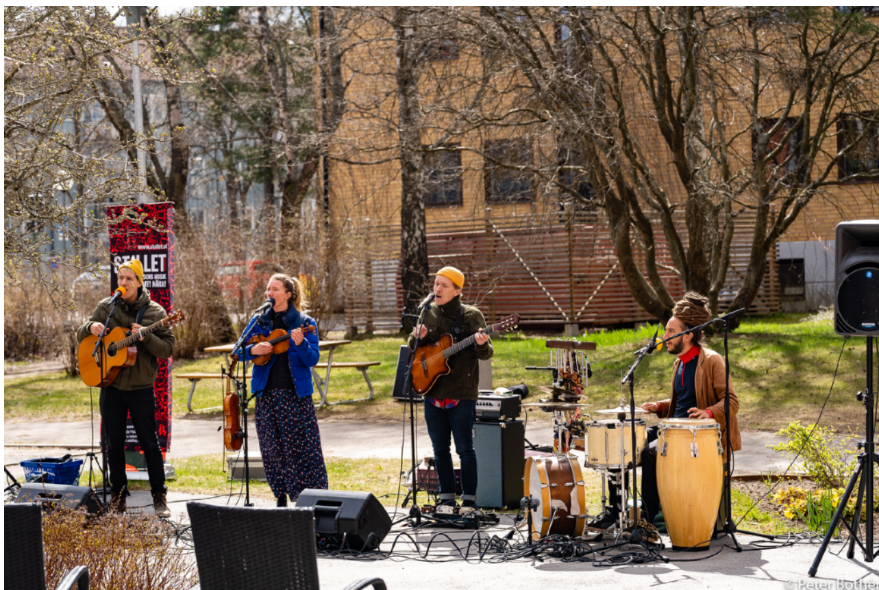
Kolonien konsert utanför Tallhöjdens Servicehus i Haninge

När Stallet lämnar hemmascenen på Stallgatan görs det under rubriken Stallet @. Vanligtvis vid konserter i Kungsträdgården och under Stockholms kulturfestival. Under 2021 gästade vi Haninge med Kolonien, Tarabband och Ebo Kr dum, Stallet till sjöss var ett annat gästspel i utanför hemmascenen.