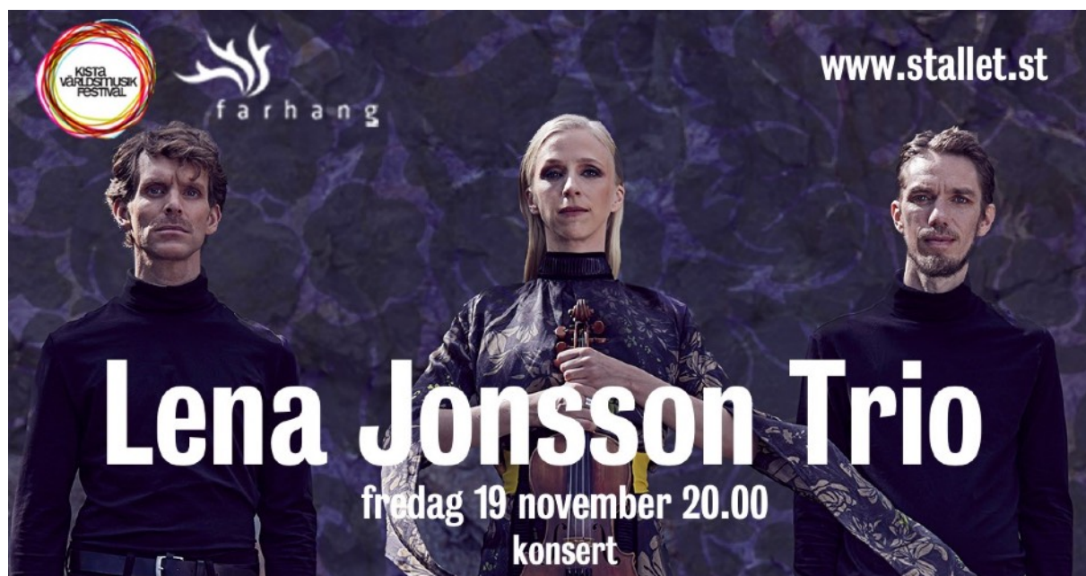
Bild med tydlig Stalletprofil som används till facebook och nyhetsbrev

Hittills har huvuddelen av informationen skett via sociala medier, facebook, instagram och Stallets hemsida www.stallet.st och det fortsatte scenen med under 2021 med ett större fokus på interaktion med publiken innan, under och efter våra livestreamade konserter och popup-evenemang. Med hjälp av olika digitala satsningar har Stallet nått ut inte bara till sin trogna publik i Sverige men även till ny internationell publik över hela världen. Att kunna ta del av de livestreamade konserterna, koppla upp sig via Zoom och dansa till folkmusiken eller chatta med Stallets kommunikatör upplevts av många som både tröstande och hoppfullt.