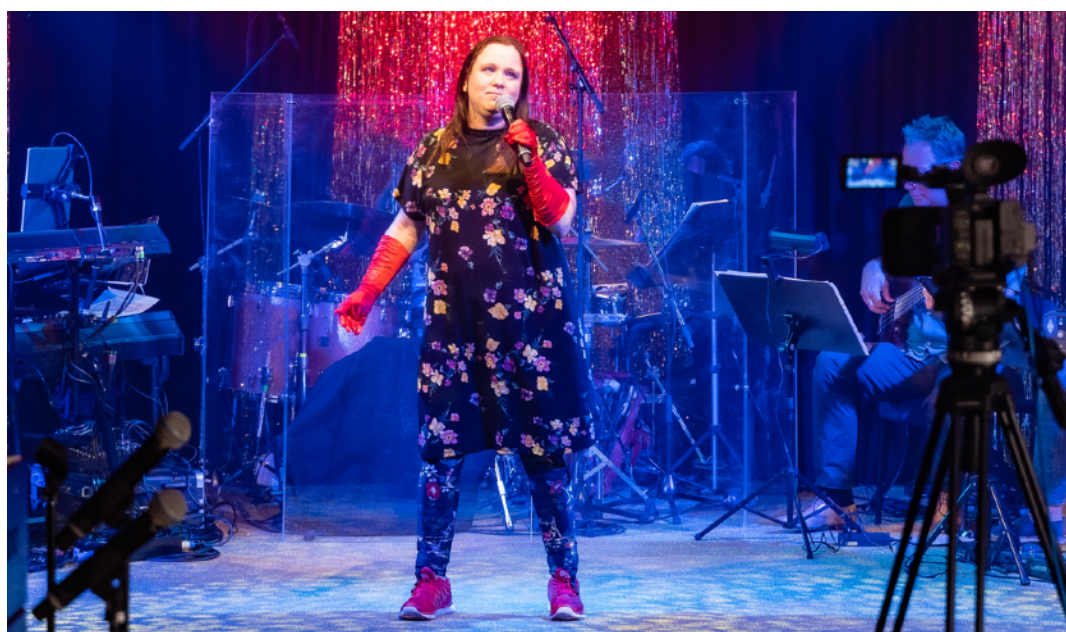
Funkisfestivalen inspelad på Stallet Världens Musik

Uthyrningsverksamheten har legat på sparlåga under året men intresset för att arrangera kulturevenemang från andra arrangörer är fortsatt stort och så även intresset av kommersiell uthyrning av Stallets lokaler. Möjligheterna till uthyrning begränsas av personalresurser och tillgänglighet.