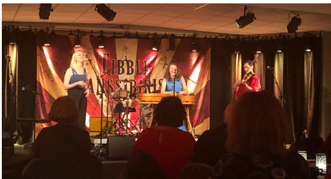
Folk Avant på regional arrangörsträff i Bollnäs

RFoD, Svensk Jazz, Kontaktnätet och Kammarmusikförbundet anordnar i samarbete med Kulturens träffar med syfte att stärka arrangörskapet på lokal nivå. Träffarna genomförs över hela landet och är ett resultat av att Kulturrådet under 2018 förändrade uppdraget till riksorganisationer inom arrangörsledet. Fem storregionala träffar var planerade 2020 av vilka två kunde genomföras. RFoD ansvarade för den första träffen som genomfördes i Bollnäs i samarbete med Kultur Gävleborg 1-2 februari med ett 40 tal arrangörer från ett flertal regioner. En andra träff arrangerades i Malmö 15-16 februari där Kammarmusikförbundet stod som värdar i samarbete med Musik i Syd. Vårens tredje planerade arrangörsträff skulle ha hållits i Trollhättan 21-22 mars med Svensk Jazz m.fl som värdar men fick ställas in pga covid19 och flyttas därmed till ett senare datum, liksom höstens två planerade träffar.