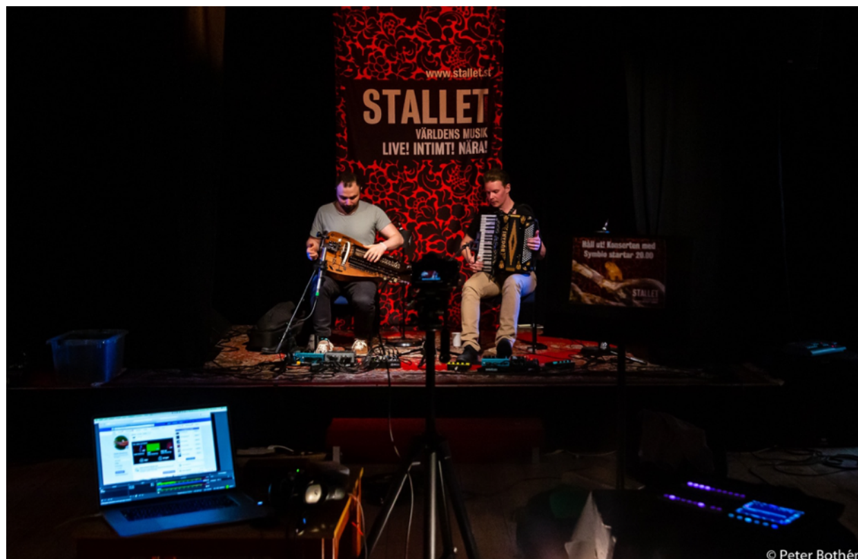
Den livestreamade konserten med duon Symbio

Detta blev startskottet för en snabb omställning till en digital verksamhet som sköttes av Stallets egen personal. När den första krisen hade lagt sig lärde vi oss allt vi kunde om livestreaming, tekniska förutsättningar, olika plattformar, vi provsände och testade och när det väl var dags för första konserten med Symbio i april var responsen enorm. Vi insåg hur mycket det betyder för vår publik men även för oss - att hålla kontakten och mötas, även om det bara är digitalt.