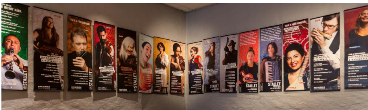
Stallets egenproducerade affischer

Stallets egenproducerade affischer, med musikerprofiler som spelat på Stallet genom åren, väcker uppmärksamhet och är uppskattat av både artister och publik. Ett slags "folk/världsmusikens Hall of Fame".