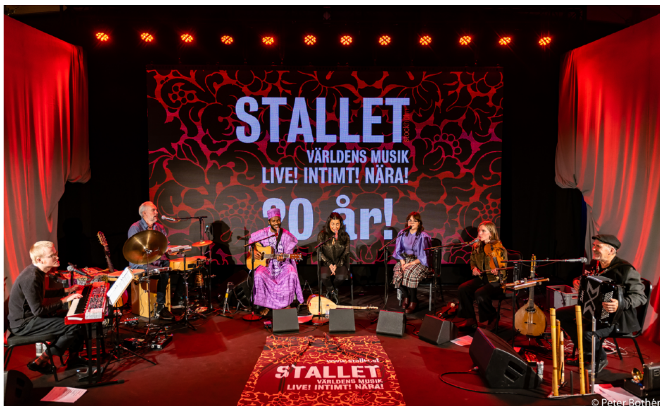
Stallets livesända jubileumskonserter

Jubileumskonserterna och de andra livesända konserterna finns förstås fortfarande att ta del av via Stallets youtubekanal stalletfilm. Länk till Jubileumskonserterna https://youtu.be/xxD95CM2Xo4