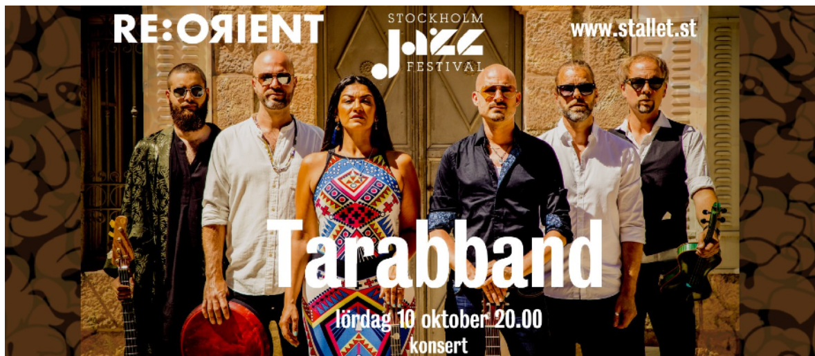
Bild med tydlig Stalletprofil som används till facebook och nyhetsbrev

Stallet Världens Musik samarbetar nära med artister och samarbetspartners för att få ut det mesta av marknadsföringen. Verksamheten får också inspiration av de artister och arrangörer som ligger i framkant när det gäller kommunikation. Stallets tydliga profil uppskattas av samarbetspartners och gästande artister och bidrar till egen tydligare marknadsföring. Fler och fler följer Stallets sida på facebook, instagram och prenumererar på Stallets nyhetsbrev. Dessutom annonserar Stallet regelbundet i branschtidningen Lira Musikmagasin, som är ett viktigt fönster mot genrens intresserade.