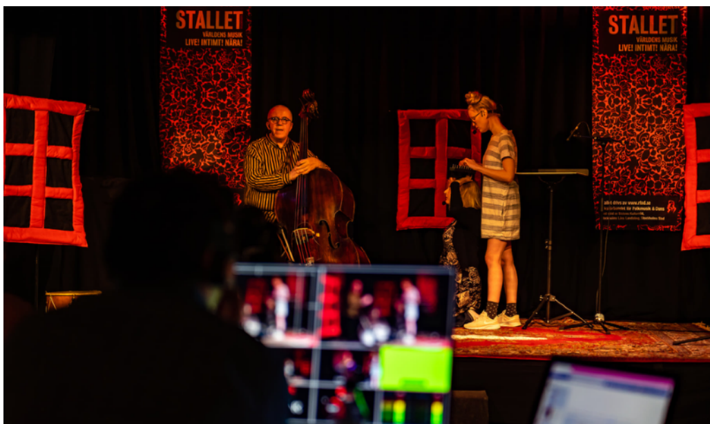
Barnföreställningen Fyra vindars hus i samarbete med 5 Folk Festival

11 (19) arrangemang riktade till barn och unga tog plats på Stallet. Programmen skedde i samarbete med NBV, Länsmusiken i Stockholm och Re:orient. Stallet önskar arrangera fler egna evenemang för och med barn unga och önskar hitta finansiering för en producent med särskilt fokus på barn och unga.