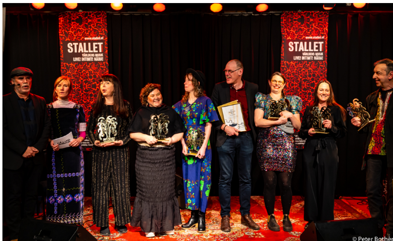
Prisutdelningen på Stallet Världens Musik

I samband med Folk & Världsmusikgalan ger vi från och med 2020 ut en utökad programtidning i samarbete med tidningen Lira där hela galaprogrammet, medverkande samt seminarier och andra kringaktiviteter presenteras. Utöver det innehåller den artiklar och information som är relevant för genren, dess aktörer och dess publik.