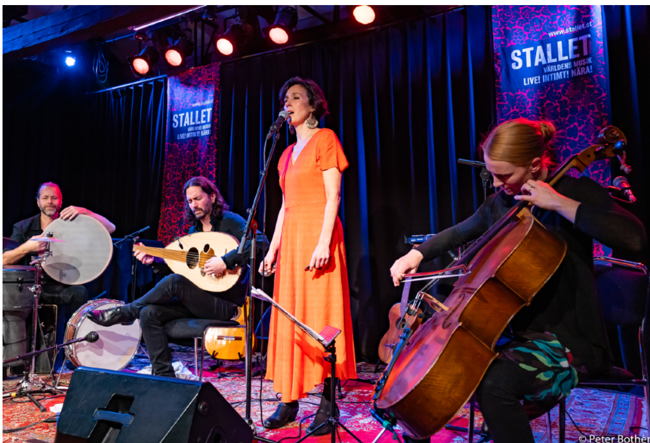
Konserten med Sirocco i samarbete med Re:Orient