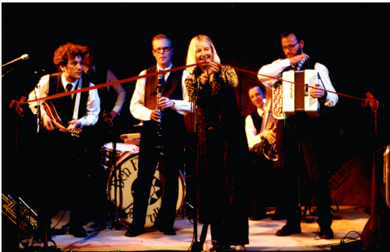
Invigningen av Stallet den 10 november 2000