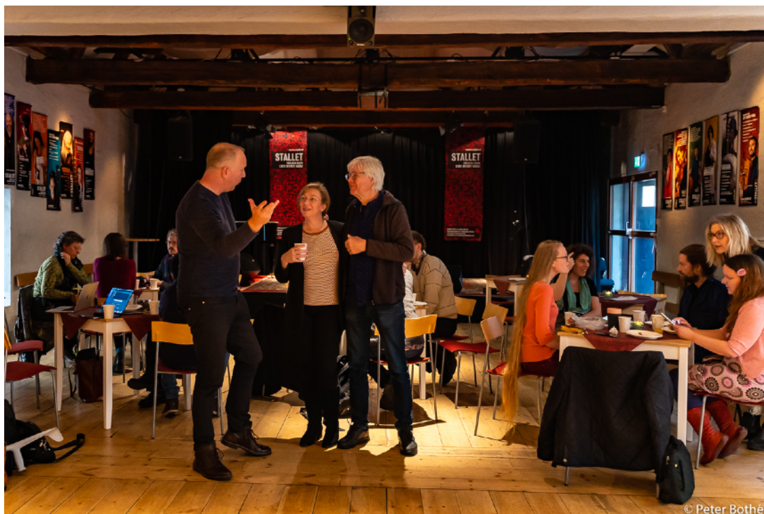
Branschfrukost på Stallet Världens Musik

Våren 2020 flyttade Branschfrukostarna till Zoom och blev digitala. Tråkigt att inte kunna mötas i verkligheten, men det förde med sig möjligheten att ses över regiongränser och även nationella gränser med deltagare från Norge, Finland och Kanada vilket vi upplever positivt.