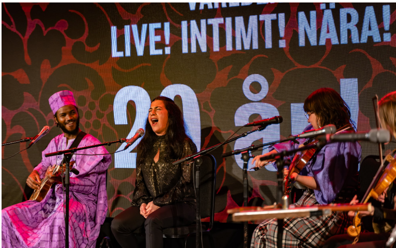
Stallets jubileumskonsert i Paviljongen

Stallets årliga sommarkonserter i Kungsträdgården och på Stockholms kulturfestival ställdes in. Stallets Världens Musiks jubileumskonsert tog plats i den tillfälliga Paviljongen i Kungsträdgården. Det blev en fin inramning till konserten med några av de mest intressanta artisterna på folkmusikscenen idag!