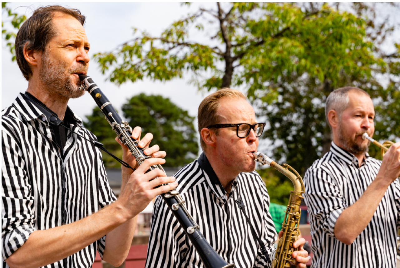
Popupkonserten med Superstar Orkestar i samarbete med Haninge kommun

Stallets egenproducerade affischer, med musikerprofiler som spelat på Stallet genom åren, väcker uppmärksamhet och är uppskattat av både artister och publik. Ett slags "folk/världsmusikens Hall of Fame".