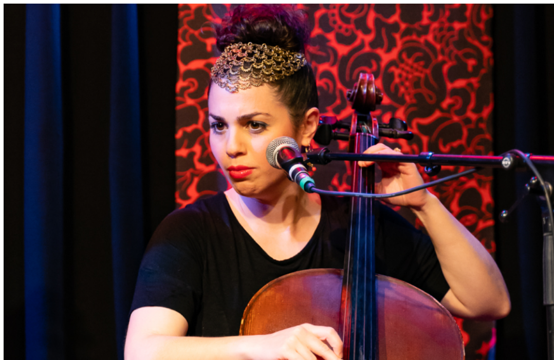
Konserten med Gulaza i samarbete med Re: Orient